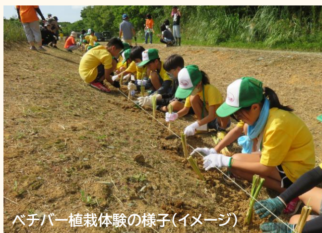
ベチバー植栽体験の様子(イメージ)

観光地をめぐりながらお掃除をしたり、地域の文化を学びながら植樹をしたり、環境美化や、人と人との交流を通じて、そこに関わる全ての方々とともに「地域を元気に、人を笑顔に。」していきたいと考えています。